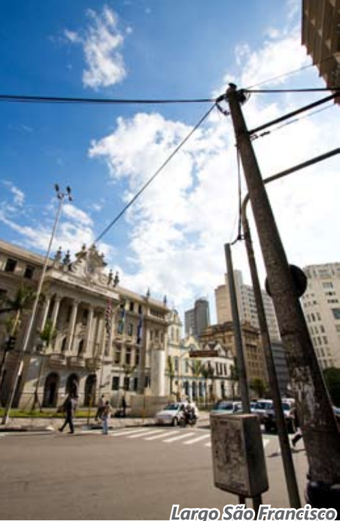
Largo São Francisco