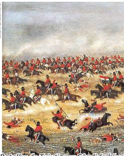
Batalha de Tuiuti, por Cândido López