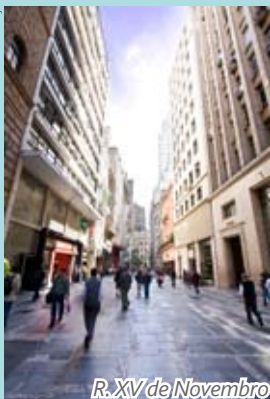
R. XV de Novembro