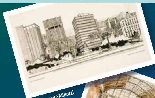
Celso Lomonte Minozzi