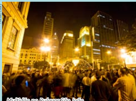
Multidão no Bulevar São João

O conteúdo editorial desta seção é de responsabilidade da Viva o Centro. Sugestões para informe@vivaocentro.org.br