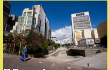
Melhor sem tapume

O Anhangabaú finalmente se livrou do tapume que cercava há quase um ano a área dos jardins, espelhos d'água, chafarizes e banheiros, próxima ao prédio dos Correios. O lugar tinha virado depósito de lixo e criadouro de mosquitos, podendo acobertar até atos de violência durante a Virada Cultural. A Viva o Centro tem alertado para o efeito pernicioso de se fechar áreas públicas com cercas ou tapumes. Os casos que ocorreram na Praça Roosevelt e no Anhangabaú demonstram que essas áreas tornam-se depósitos de lixo e esconderijo de marginais, causando problemas e trazendo intranquilidade à população.