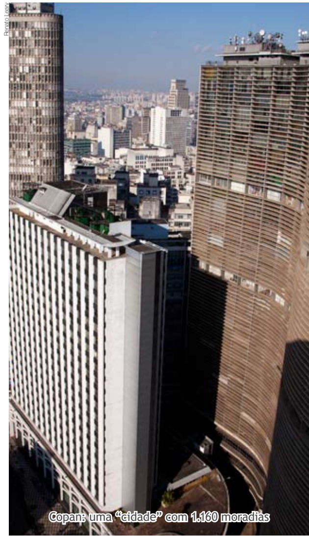
Copan: uma “cidade” com 1.160 moradias

A moradia no Centro Histórico, até pelas dimensões da área - Sé e República têm 4,4 km ou 0,3% da área do município - , deve ser vista como fator de recuperação da região e não como solução para o problema habitacional, segundo a Viva o Centro. E isto porque o adensamento exige naturalmente um espaço público de qualidade. Moradores querem ruas, praças e parques bem cuidados, atendimento social eficiente, segurança efetiva e infraestrutura reforçada.