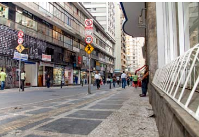
Na D. José de Barros, recuperação das calçadas