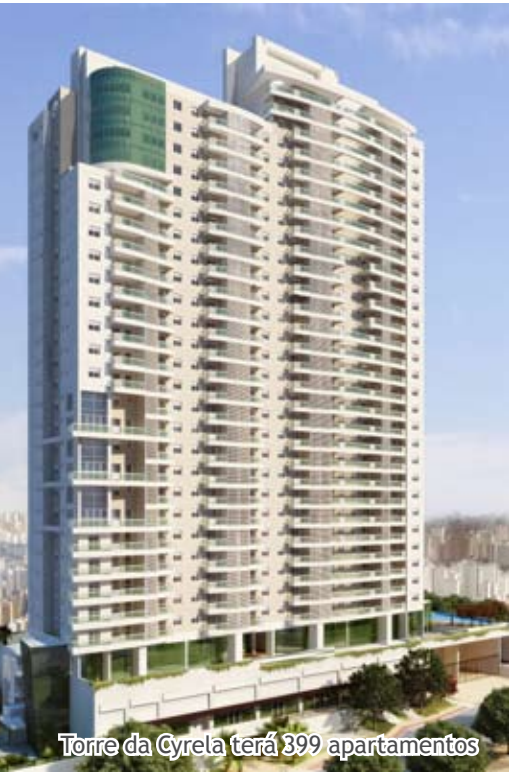
Torre da Cyrela terá 399 apartamentos