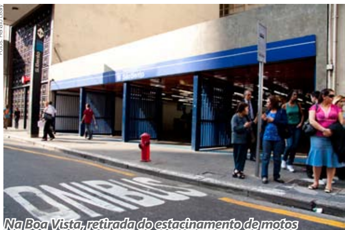
Na Boa Vista, retirada do estacionamento de motos