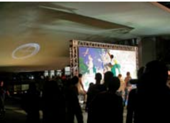
Evento da Virada Cultural na Praça do Patriarca

pelo arquiteto Paulo Mendes da Rocha, é muito esperado pela coletividade do Centro. (Por Wellington Alves)