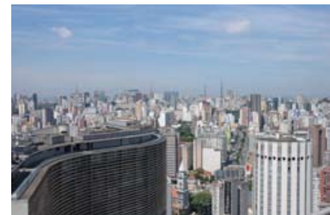
Centro sintetiza aspectos da nossa identidade