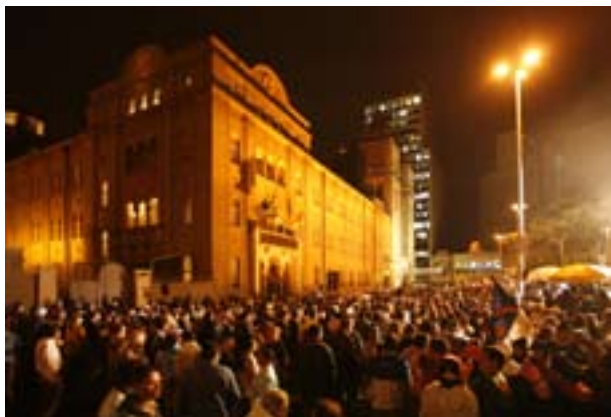
Milhares de pessoas no Centro para ver o papa

Brasil vieram ao Centro e conheceram seus lugares históricos. “Caminhei pelo Centro. Fui na Catedral da Sé e no