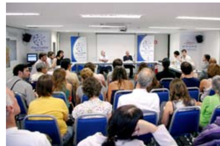
Auditório lotou para acompanhar discussão sobre identidade paulistana