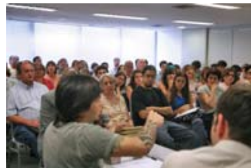
Baixo Ribeiro: “É preciso não ignorar os jovens”

Jorge da Cunha Lima acredita que pontos marcantes da história e o grande leque de opções culturais encontradas nos teatros e exposições de São Paulo é que definem o caráter da cidade. “No entanto, vale perguntar: