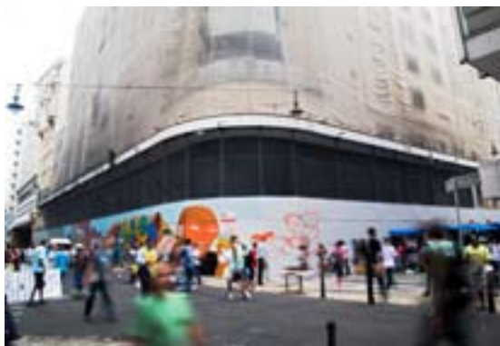
Espaço Provisório do Sesc 24 de Maio funcionando

O papa Bento XVI ficou no Mosteiro de São Bento nos dias 9, 10 e 11. Ele participou de várias atividades, conversou com autoridades e abençoou 11 vezes da sacada do Mosteiro a multidão que se aglomerava no Largo São Bento. Quando ele saía para outros locais as pessoas tomavam as ruas para vê-lo. A visita foi um sucesso e ele pode voltar em 2011